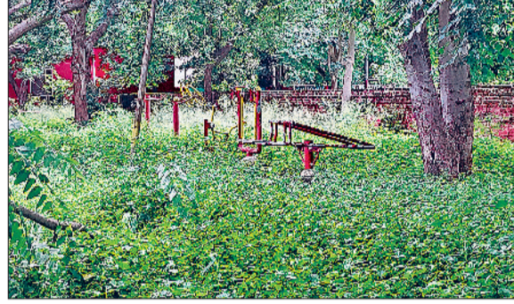
रेवाड़ी। पुराने हाउसिंग बोर्ड के सामने पार्क में डाला गया कचरा।