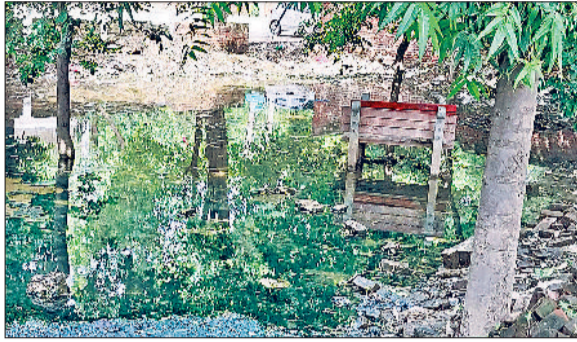
रेवाड़ी। ब्रास मार्केट के तिकोना पार्क में कीचड़ में तब्दील पानी, सीवर के पानी से लबरेज सेक्टर-1 का पार्क, पुराने हाउसिंग बोर्ड के सामने पार्क में ओपन जंग खा रही जिम मशीनें व ऊगी खरपतवार।

नगर परिषद की लापरवाही के कारण शहर के पार्कों की दशा बिल्कुल बिगड़ चुकी है। नेहरू पार्क व सेक्टर-1 के होलिका पार्क में लंबे समय से सीवर सिस्टम आफल बना हुआ है। सेक्टर का पार्क को सीवर ओवरफ्लो के गंदे पानी से पूरी तरह लबरेज है। सेक्टर-1 में सीवर की समस्या का समाधान नहीं हो रहा है। सफाई के पीने के पानी में भी कई बार सीवर का पानी मिलकर सफाई हो रहा है। समस्या को लेकर सेक्टरवासी दर्जनों बार प्रशासन को ज्ञापन देकर समस्या के समाधान की मांग कर चुके हैं, लेकिन प्रशासन की अनदेखी के कारण व्यवस्था चरमरा गई है। पार्कों की दयनीय हालत के कारण लोग पार्कों से किनारा करने लगे हैं। जगह-जगह कचरे के ढेर लगे हुए हैं यहाँ तक कि पार्कों में रखे डस्टबिनों के कचरे को भी फेंका नहीं जा रहा है। पार्कों की देखरेख