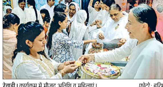
रेवाड़ी। कार्यक्रम में मौजूद अतिथि व महिलाएं।

सांस्कृतिक प्रस्तुतियों ने लोगों को भावविभोर किया हरिभूमि न्यूज >>> रेवाड़ी