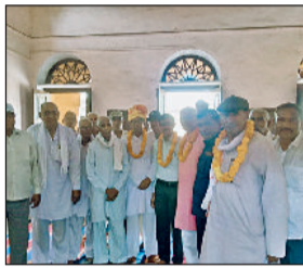
रेवाड़ी। एक्स पैरामिलिट्री फोर्स वेलफेयर एसोसिएशन की बैठक में मौजूद पूर्व अर्ध सैनिक।