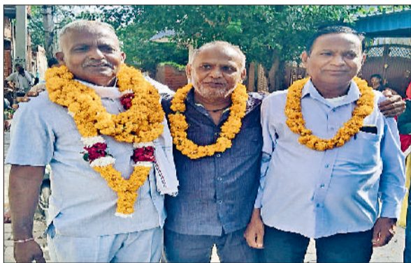
रेवाड़ी। नगरपालिका संघ के नवनिर्वाचित पदाधिकारी।