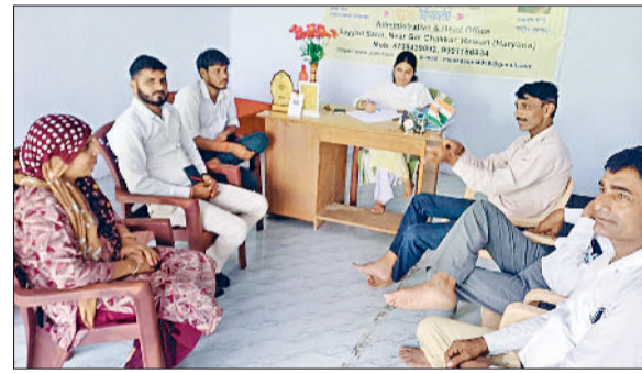
रेवाड़ी। बैठक करते हुए जनशक्ति जागृति मंच ट्रस्ट के सदस्य।