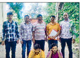
रेवाड़ी। गिरफ्तार किए गए आरोपी सीआईएफ टीम के साथ।

आरोपियों ने उन्हें शोर मचाने पर जान से मारने की धमकी दी और उनके मोबाइल भी छीन लिए। इसके बाद आरोपियों ने घर में मौजूद उसकी नन्द व उसका का यौन उत्पीड़न करके, अश्लील वीडियो भी बना ली। आरोपियों ने उनके घर से लाखों रुपए के सोने चांदी के जेवर लूट लिए और उनके घर से सीसीटीवी का सैटअप बाक्स भी उखाड़ कर ले गए। आरोपियों ने उनकी अश्लील वीडियो सोशल मीडिया पर वायरल करने की धमकी भी दी। जिस पर पुलिस ने आरोपियों