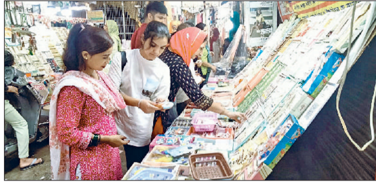
रेवाड़ी। बास मार्केट में दुकान पर सजी राखियां। और दुकान पर राखियों पसंद करती महिलाएं।