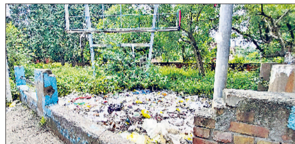
रेवाड़ी। पुराने हाउसिंग बोर्ड के सामने पार्क में डाला गया कचरा।

शहर के नेहरू पार्क, राव तुलाराम पार्क, नेताजी सुभाष पार्क, ब्रास मार्केट पार्क सहित सेक्टर-1,