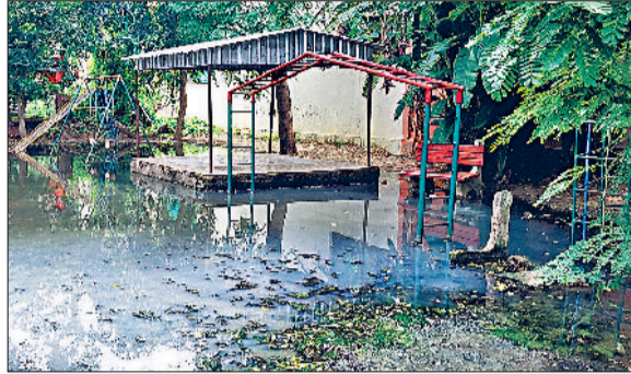
पार्क में दो महीने से जमा सीवर का पानी नगर परिषद की सुस्त कार्यशैली के कारण शहर में सफाई व्यवस्था बेहाल हो गई है। सड़कों के किनारे कचरे के ढेर व नाले गंदगी से सरोबार पड़े हैं। सफाई नहीं होने से सीवर भी उफान मार रहे हैं। नगर परिषद व जनस्वास्थ्य विभाग की सुस्त कार्यशैली के कारण सेक्टर-1 का होलिका लंबे समय से सीवर के गंदे पानी से लबरेज है, जिससे उठती दुर्गंध के कारण सेक्टरवासी परेशान हैं। शहर के सेक्टर-1 स्थित होलिका पार्क यह समस्या बार-बार पैदा हो रही है। प्रशासन की ओर से पार्कों में जमा होने वाले सीवर के गंदे पानी की समस्या का कोई ठोस प्रबंध तक नहीं किया जा रहा है। गंदे पानी के जमा होने के कारण पार्क में लगी घास व पौधे भी खत्म हो गए हैं।