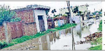
रेवाड़ी। अवैध कब्जे के कारण गांव के रास्ते में एकत्रित दूषित पानी।

रेवाड़ी। मीरपुर के रास्ता नं. 72 पर किए गए अवैध कब्जे को हटवाने के आदेश कागजों में धूल फांक रहे हैं। अवैध कब्जा नहीं हटने के कारण आसपास के 20 गांवों के लोगों को भारी परेशानी का सामना करना पड़ रहा है। ग्रामीणों ने प्रशासन से कब्जा हटवाने की मांग की है, ताकि ग्रामीणों को इससे राहत मिल सके। ग्रामीणों के अनुसार गांव के प्रभावशाली लोगों ने प्रमुख रास्ते पर अवैध कब्जा किया हुआ है। कब्जा हटवाने के लिए डीसी और एडीसी की ओर से पूर्व में आदेश जारी किए जा चुके हैं। डीसी ने 26 फरवरी 2024 को डीडीपीओ को कब्जा हटवाने के आदेश दिए थे, परंतु यह कब्जा आज तक नहीं हटा है। कब्जा नहीं हटने