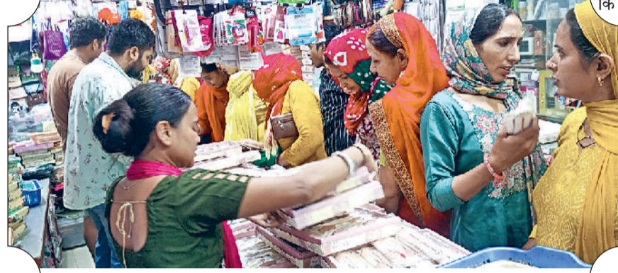
रेवाड़ी। राखी खरीदने के लिए दुकान में लगी महिलाओं की भीड़।

पूरी तरह सज चुके हैं। बाजार में राखियां खरीदने के लिए बड़ी संख्या में महिलाएं पहुंच रही हैं। गत वर्ष की अपेक्षा इस वर्ष राखियों के दामों में 25 से 30 प्रतिशत तक उछाल आया हुआ है। दुकानदारों का कहना है कि पिछले वर्ष से राखियों की कीमत बढ़ गई है। बाजार में 50 रुपये से कम अच्छी राखी नहीं है। महिलाएं अपने भाईयों के लिए खुले मन से राखी खरीद रही हैं। वहीं रक्षाबंधन पर महिलाओं को फ्री यात्रा कराने के लिए रोडवेज ने भी पूरी तैयारी के