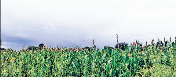
रेवाड़ी। एक खेत में पकाव के लिए तैयार हो रही बाजरे की फसल।

रही है। अगस्त माह की शुरूआत के साथ ही जिले में औसत 150 एमएम तक बारिश हो चुकी है। दो दिन तक लगातार बारिश के बाद तापमान में गिरावट आने से उमस भरी गर्मी का असर कम हो गया था। अब एक बार फिर गर्मी पसीने छुड़ाने लगी है। रविवार को अधिकतम तापमान 1.0 डिग्री सेल्सियस बढ़कर 33.5 डिग्री सेल्सियस पर पहुंच गया। रात का तापमान भी 2.0 डिग्री सेल्सियस की वृद्धि के साथ 23.0 डिग्री सेल्सियस दर्ज किया गया। दोनों तापमान बढ़ने से गर्मी रात को भी परेशान कर रही